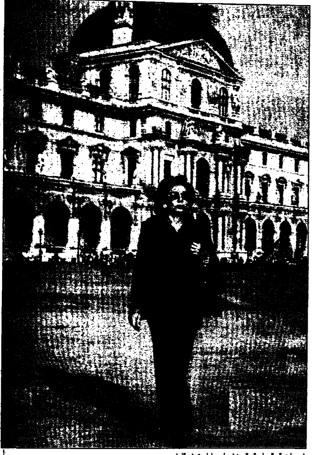
فرح بهلوي في القصر والي البيت في باريس أمام متحف اللوفر

باريس - «القدس العربي» منذ عشرين عاما تعيش بالامبراطورة فرح بهلوي في المنفى، لم تزل تلهو وتتمنى ان تعود الى بلدها، في عام 1978 سقط العرش الشاهنشاهي والى غير رجعة، وعلى اثر تلك الثورة كما هو معروف رحل الشاه وعاشته عن طهران. فقد جمعت هذه الثورة للجد من اقربائه فقد كانت زوجة «القوي» رجل في العالم آنذاك، في نفس لحظات حياتها توجست في موت الشاه عام 1980 في القاهرة، واليوم تعيش بالامبراطورة الخفية بين باريس حيث تعيش والبنها، وبين الولايات المتحدة حيث يقام اولادها، لكنها لا تزال لا تفكر واحدة وهي العيش في ريف ايران - حوار ساخن تحدثت فيه الامبراطورة فرح عن حياة الاصدقاء، والايمان، والاموال والشايات.